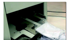
Ausgabe der gefalteten und verpackten Textilien